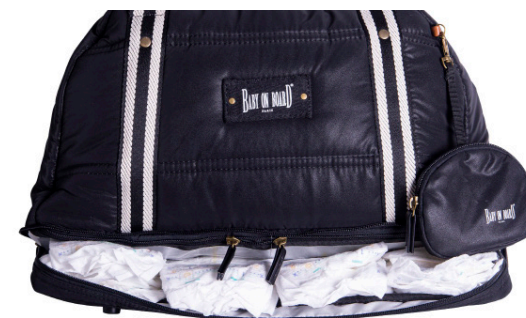
Son double fond permet de stocker les couches ou les vêtements