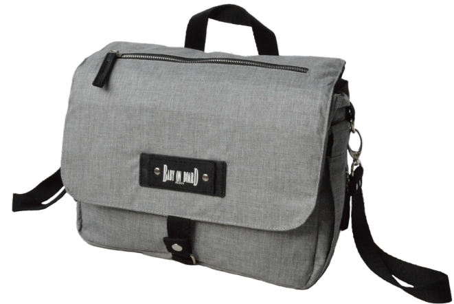
Ref 900100_002 STREET