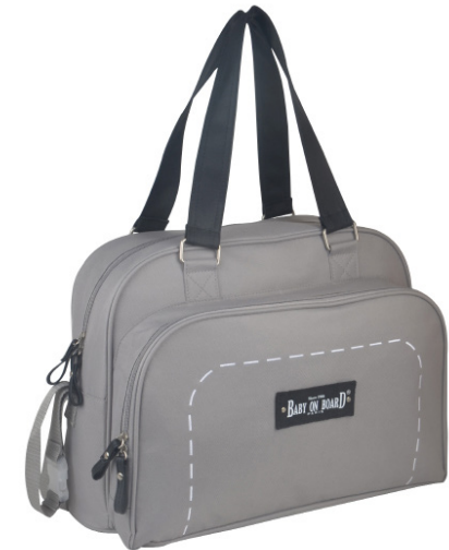
Ref 216710_023 SUSHI