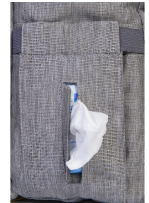
Distributeur de lingette