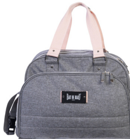
Ref 216711_014 SWEET PINK