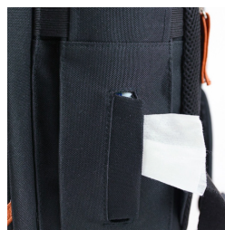
Distributeur de lingette

Ouverture totale et extension 24h Multiples rangements malins