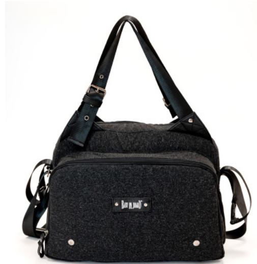
Ref 216730_008 BLACK CHINÉ