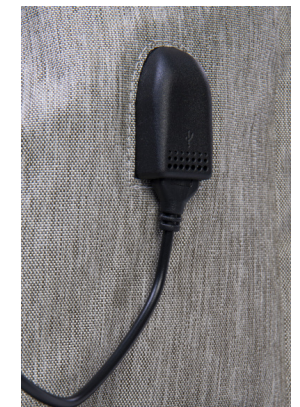
Port USB intégré

Bretelles ergonomiques Attaches poussettes Tapis à langer