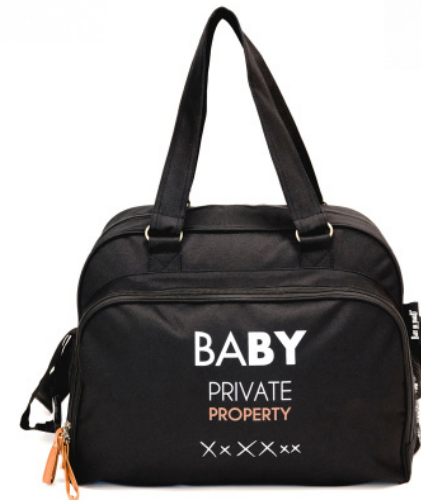
Ref 216710_031 BABY PROPERTY