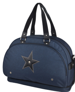
WEEK END TEAM