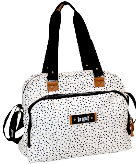
Ref 216720_028 DOTS