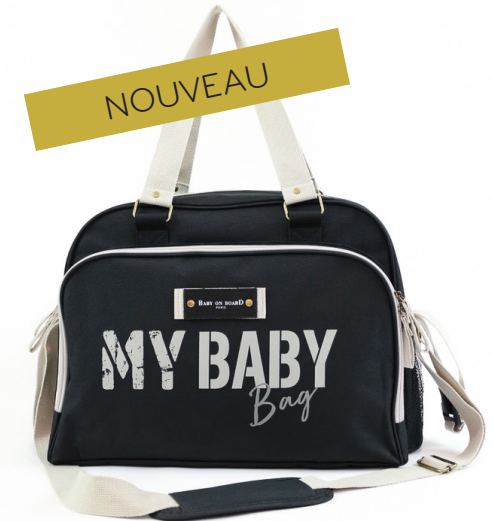
Ref 216710_100 BABY BAG NOIR