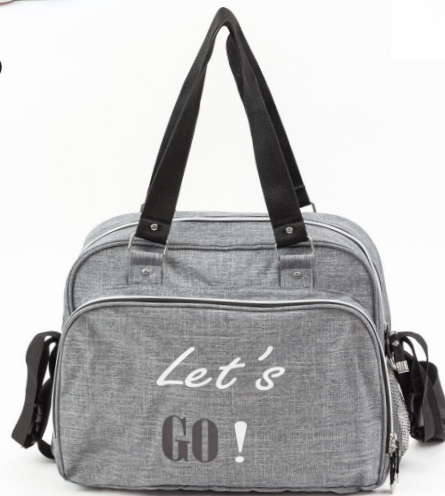
Ref 216710_041 LET'S GO