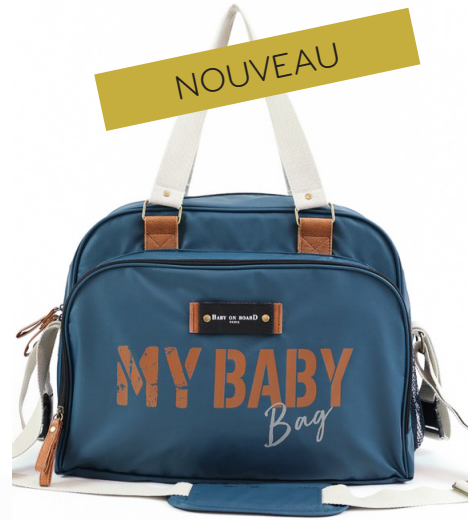
Ref 216710_101 BABY BAG OCEAN