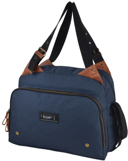
Ref 216730_003 MOONLIGHT