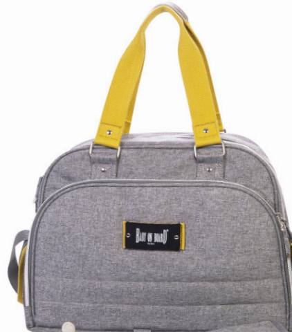
Ref 216711_023 YELLOWSTONE