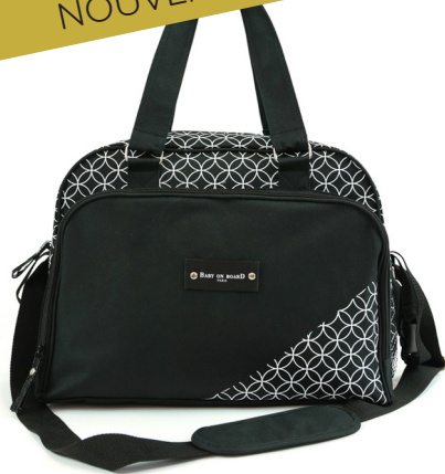
Ref 216710_090 STAR