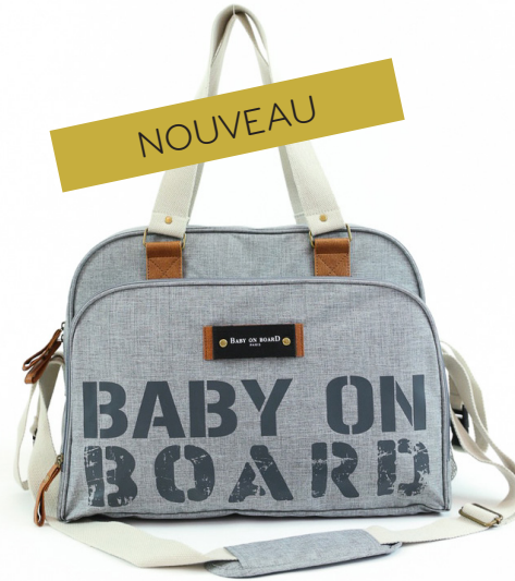
Ref 216720_012 STREET