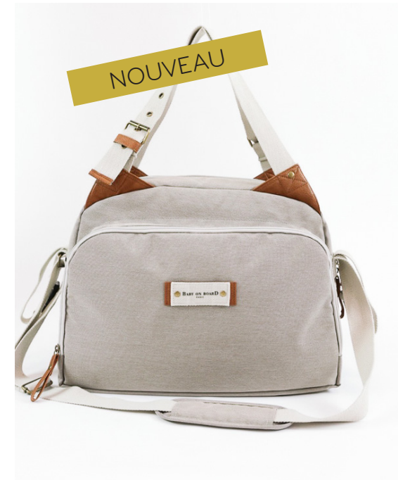
Ref 216730_005 GREIGE