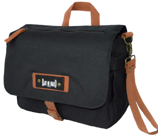
Ref 900100_001 BLACK

Compact et multiples rangements, l'essentiel pour bébé à porter de main .