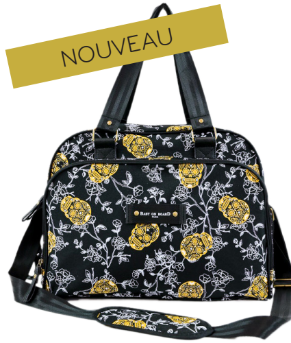
Ref 216611_070 SKULL LOOK