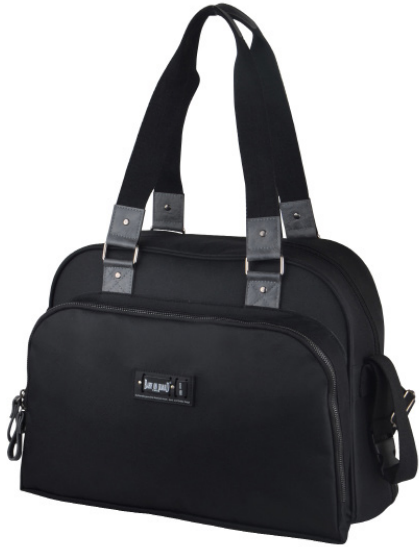
Ref 216720_022 CLASSIC BLACK