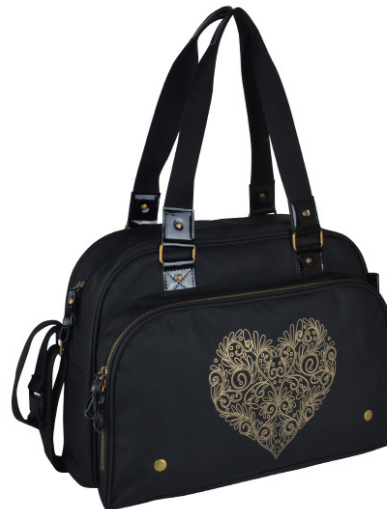
Ref 216611_017 LOVE TATOO