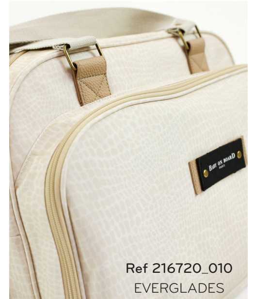
Ref 216720_010 EVERGLADES