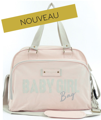
Ref 216710_080 BABY BAG ROSE VINTAGE