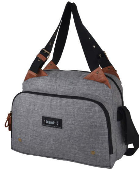
Ref 216730_001 CITY GREY