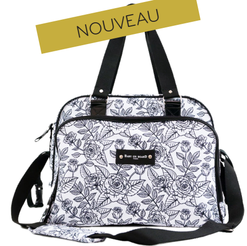
Ref 216611_060 ROSES