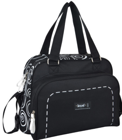
Ref 216710_008 SWIRL