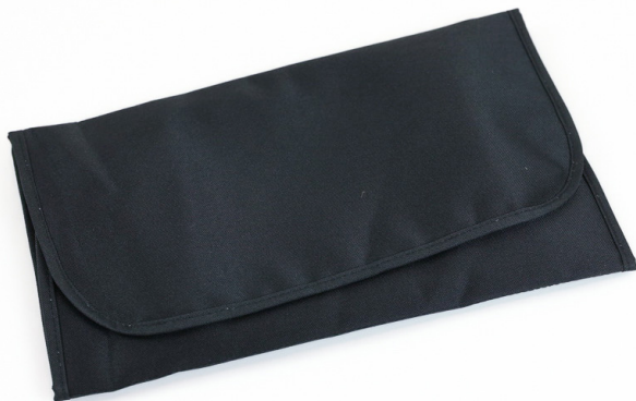
Ref 900200_220 BLACK